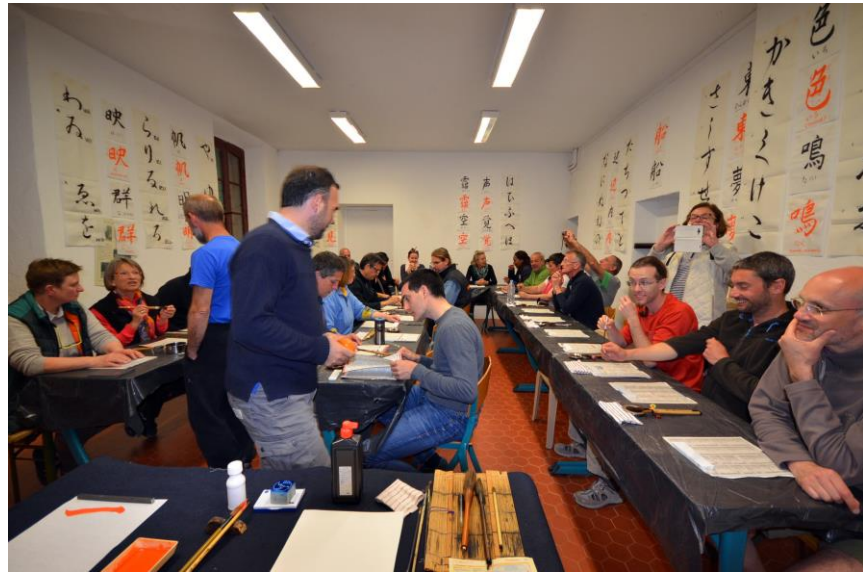
Au travail !