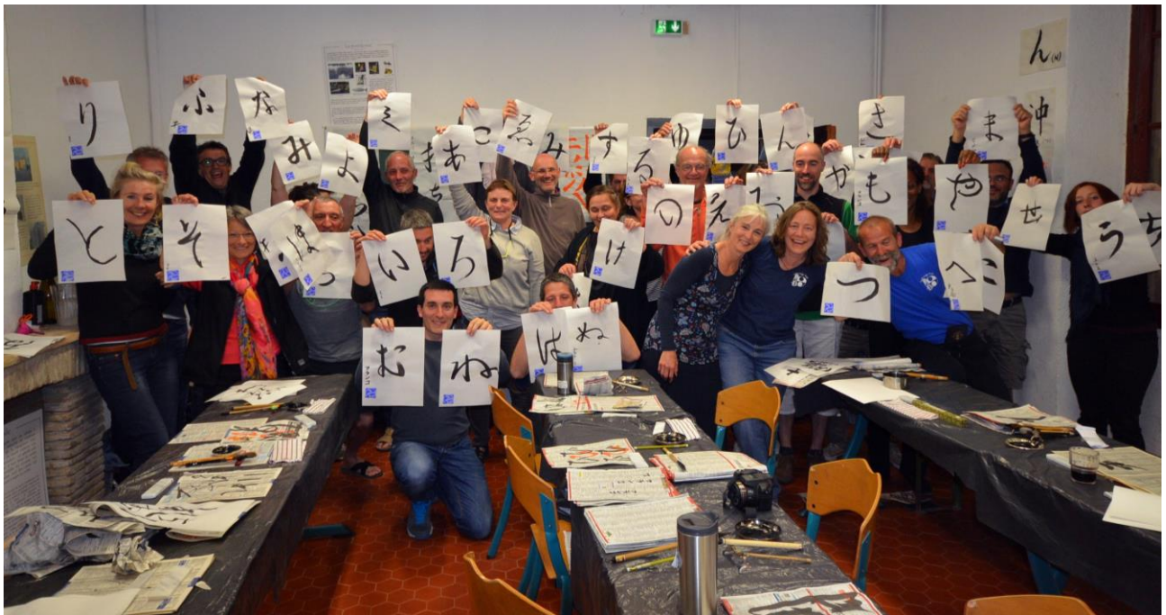
Le « Tori naku » rend joyeux